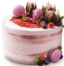
Queque y tortas