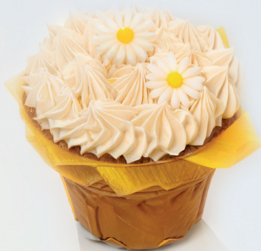
MUFINS QUE SORPRENDEN

SORPRENDAMOS CON CREATIVIDAD, SABOR Y DULZURA.