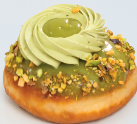
BERLINESAS QUE ENAMORAN