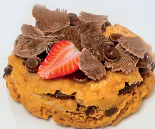
GALLETAS QUE ENGRÍEN